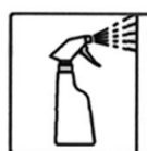
НАНЕСТИ СПРЕЕМ НА ПОВЕРХНОСТЬ