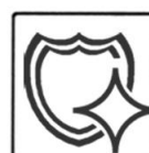
СРЕДСТВО С ЗАЩИТНЫМ ЭФФЕКТОМ