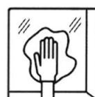
ВЫТЕРЕТЬ ПОВЕРХНОСТЬ НАСУХО